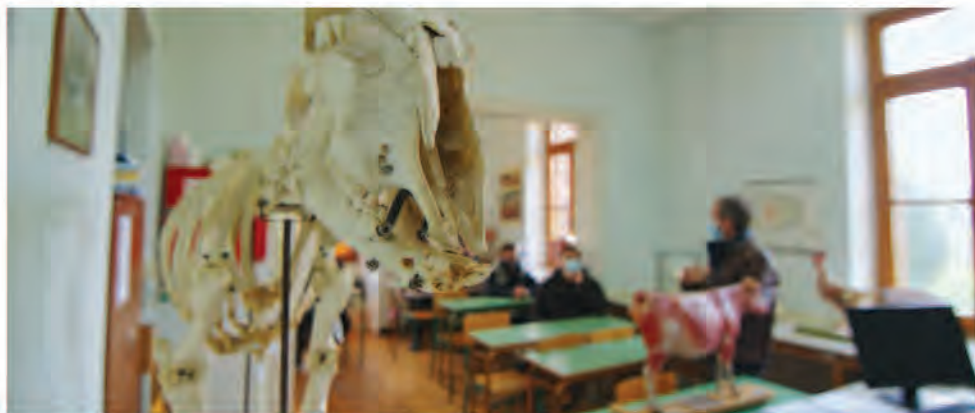
ΕΙΔΙΚΟΤΗΤΑ 1: ΔΙΑΧΕΙΡΙΣΤΗΣ ΣΥΣΤΗΜΑΤΩΝ ΕΚΤΡΟΦΗΣ ΑΓΡΟΤΙΚΩΝ ΖΩΩΝ

Στις εγκαταστάσεις της Αβερώφειου Γεωργικής Σχολής Λάρισας, σε ένα περιφραγμένο αγρόκτημα 40 στρεμμάτων με συγκρότημα 43 διατηρητέων κτηρίων, ανάμεσά τους και το εμβληματικό κτήριο της βιβλιοθήκης, το ΙΕΚ συνεχίζει την υπερεκατονταετή εκπαιδευτική ιστορία της Σχολής και λειτουργεί στον χώρο με σύγχρονες δομές εκπαίδευσης και κατάρτισης σπουδαστών για δύο ειδικότητες, που περιλαμβάνουν εργαστήρια γεωργικών μηχανημάτων και μηχανολογίας, καθώς και βουστάσιο, χοιροστάσιο, πτηνοτροφείο και καλλιεργήσιμους αγρούς.